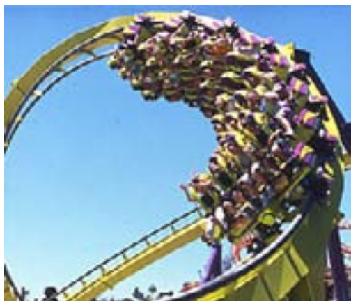
Six Flags Amusement Park