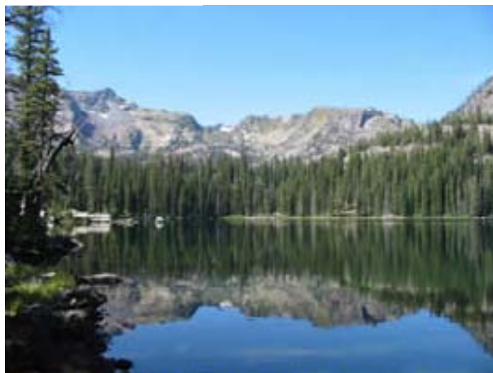
Crescent Lake in the Mission Mountains Wilderness Area