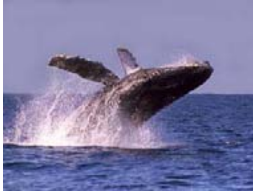
Avistamiento de ballenas